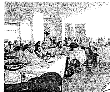
Le séminaire a réuni près d'une centaine de participants de Papouasi Fidji, Cook, Nauru, Niué, Samoa, Salomon et Vanuatu, représentant la sphère politique, économique et la société civile.