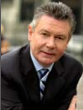
KAREL DE GUCHT